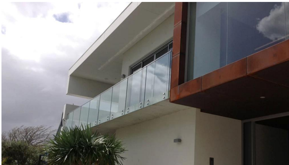
Escaleras de vidrio de acero inoxidable 316 enfrentamiento vidrio sólido, proyecto de barandilla de vidrio cubierta al aire libre,