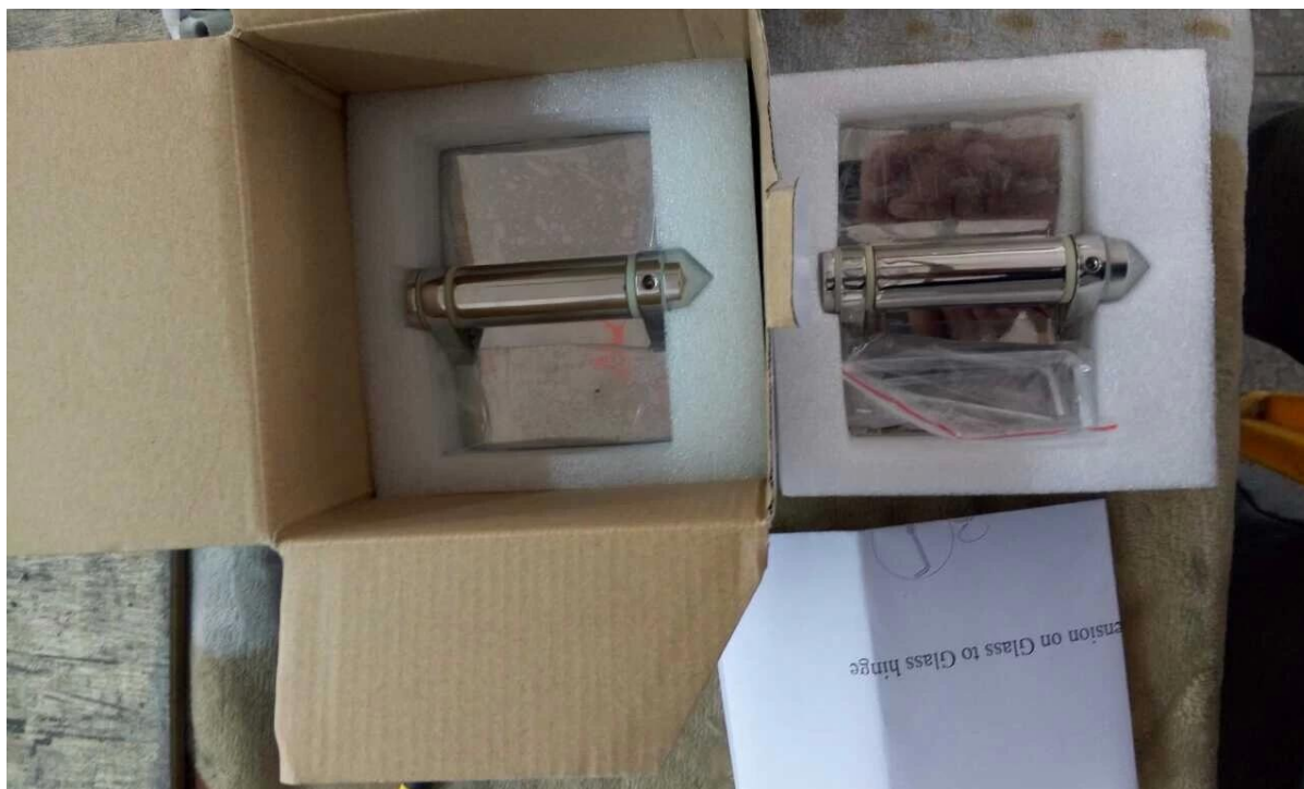
Fotos del proyecto # para bisagra de puerta resistente resorte carga acero inoxidable cristal