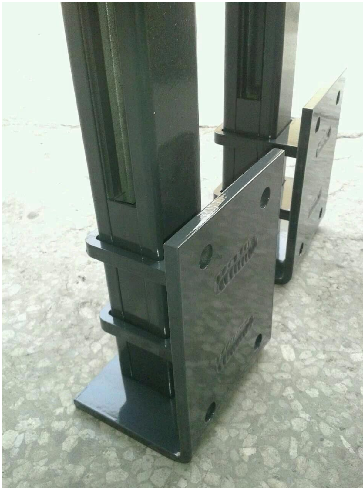
4. aluminio foto de su perfil pasamanos y posterior embalaje, tija de aluminio,