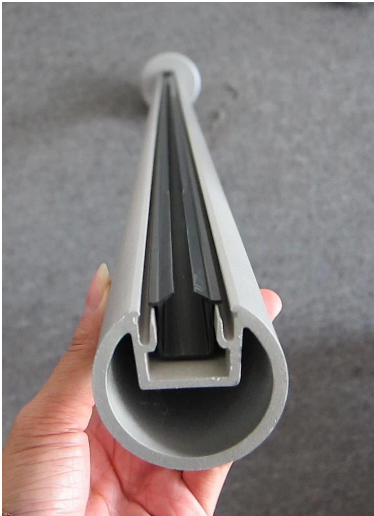
De aluminio poste barandilla de balcón, proyecto de escalera de barandilla de vidrio para su referencia,