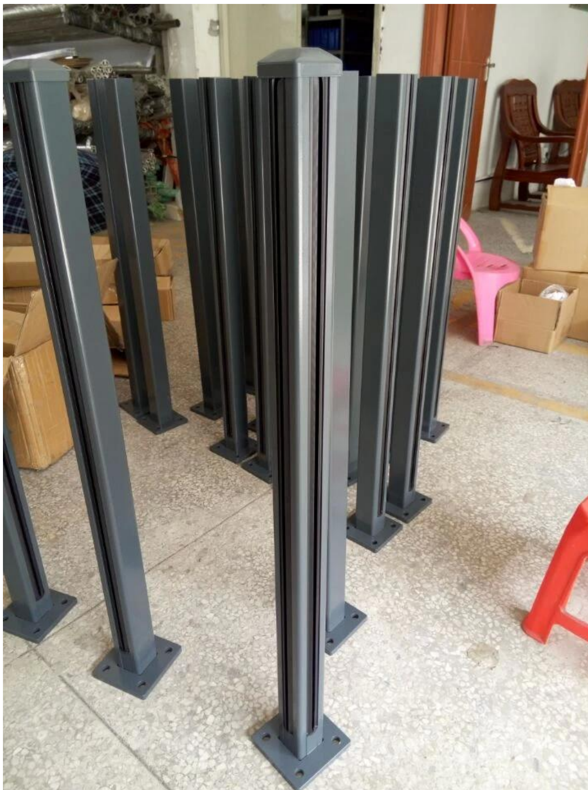
Aluminio pretil publicar balcón, proyecto de barandilla de vidrio cerca de la piscina para su referencia,