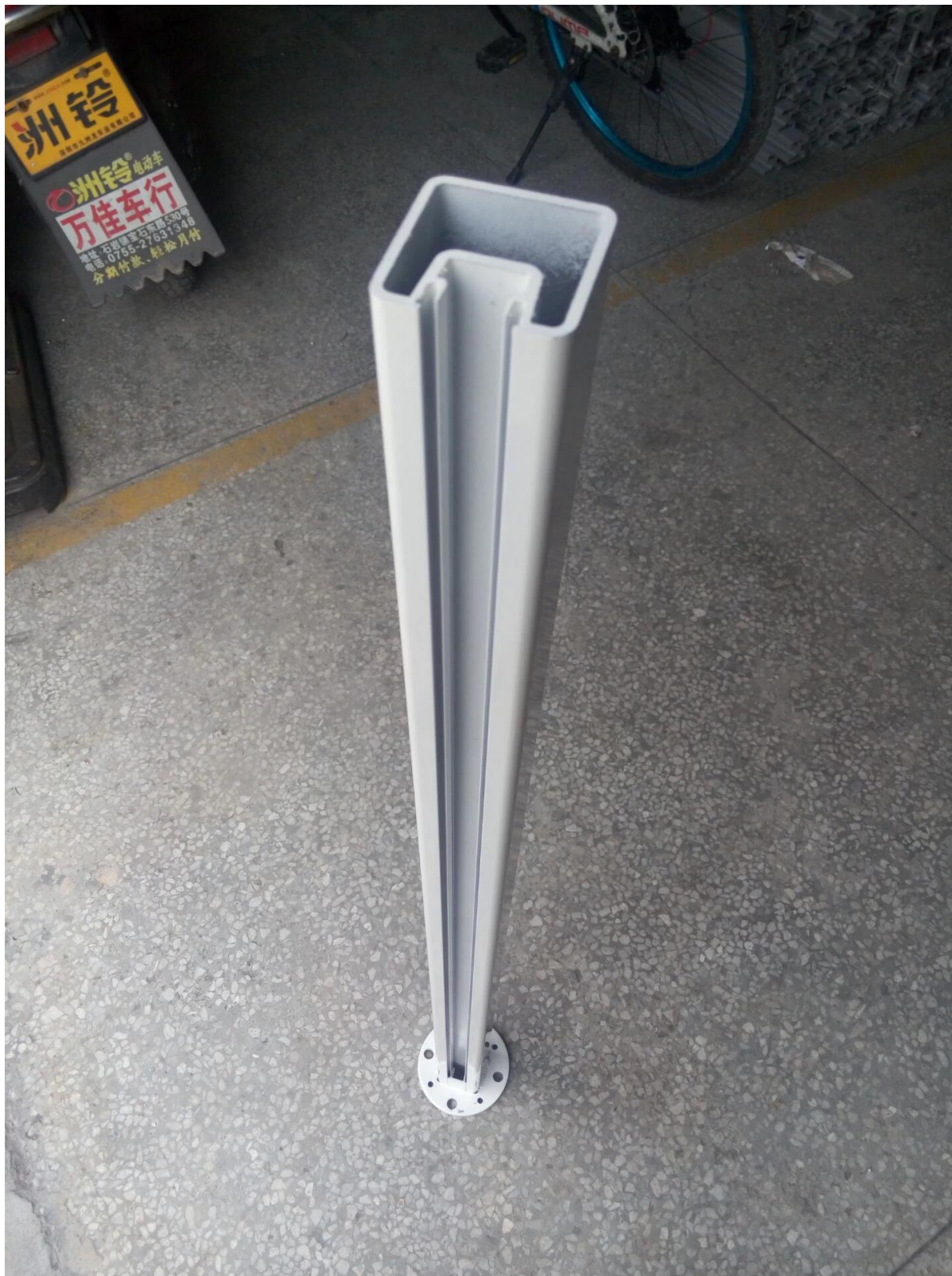
tija de aluminio valla de negro cuadrado de encargo,