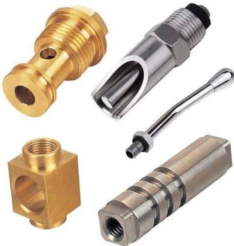
16. Piezas de mecanizado de precisión