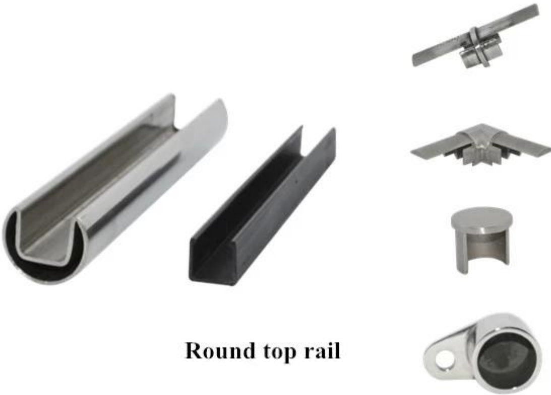
Round top rail