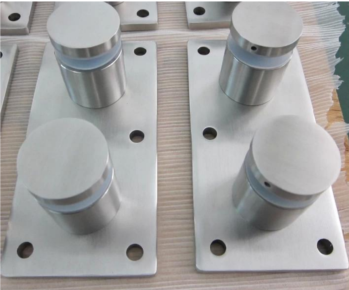
4. acero inoxidable 316 de grado marino fotos del proyecto materiales de cierre de vidrio soporte del panel de cristal enfrentamiento: