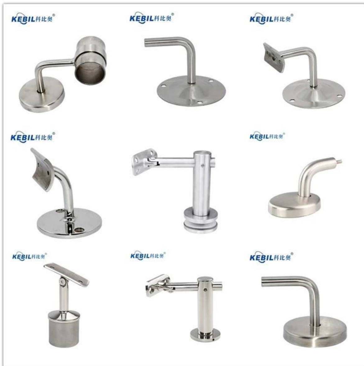
Pasamanos con ranura -