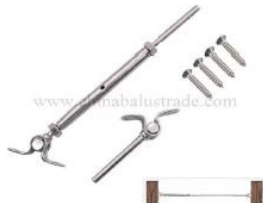
T806- 4mm cable