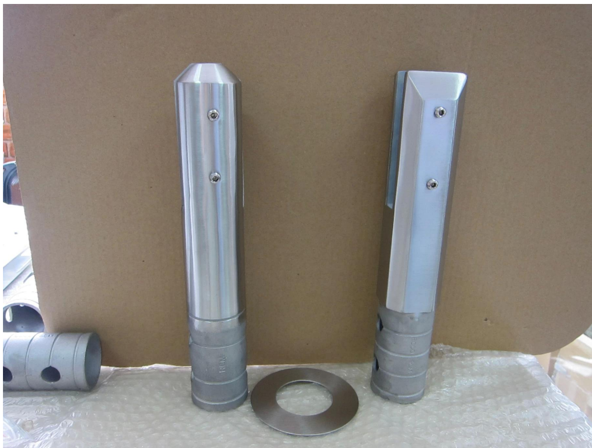
3. perforación Core & la placa de base 4 tipos espitas javascript: void (0); /* 1467362864636 */