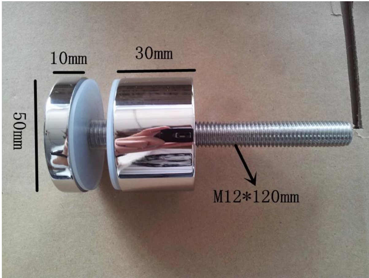
Modelo No .: SF-30