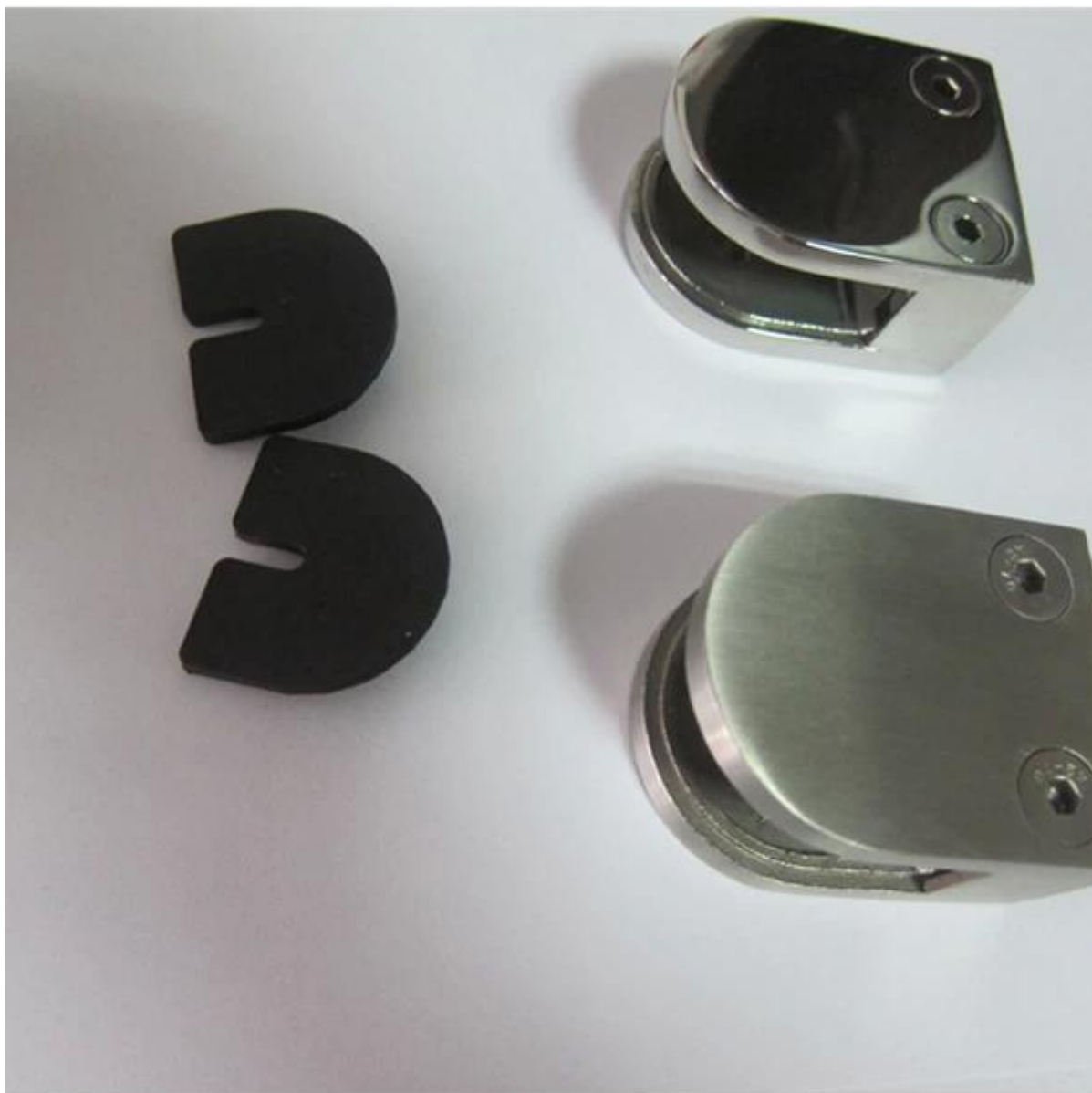
3. abrazadera tipo de cristal cuadrado en acabado de espejo para el vidrio 8-10mm