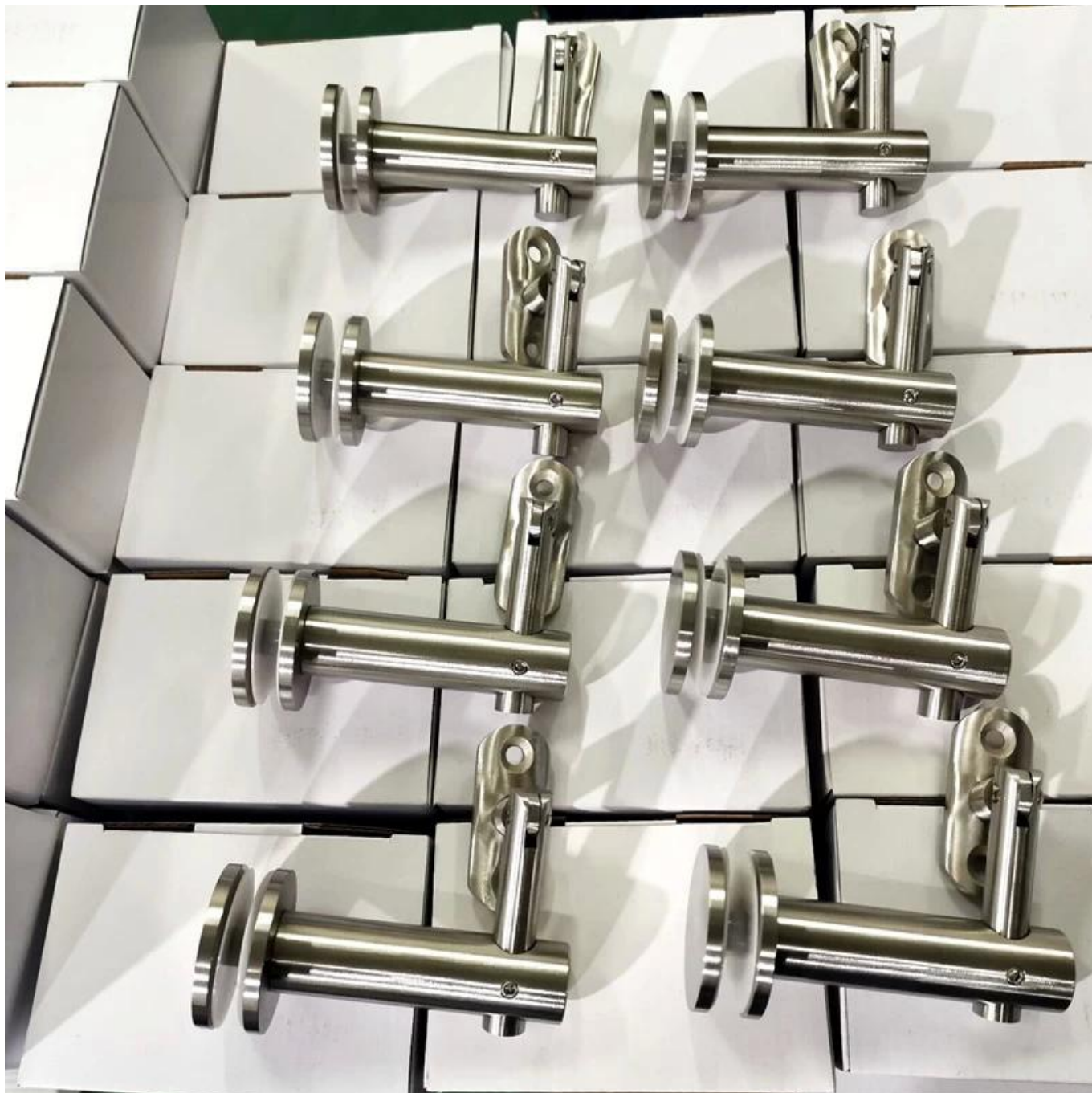
Fotos del proyecto de pasamanos de vidrio -