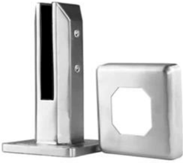
MODEL # SBM