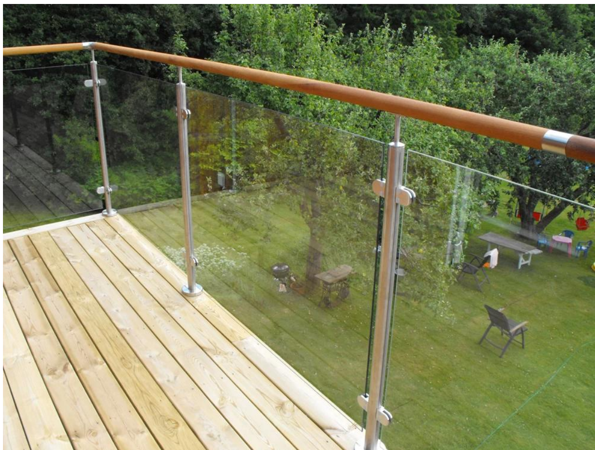
balcón al aire libre barandilla de vidrio