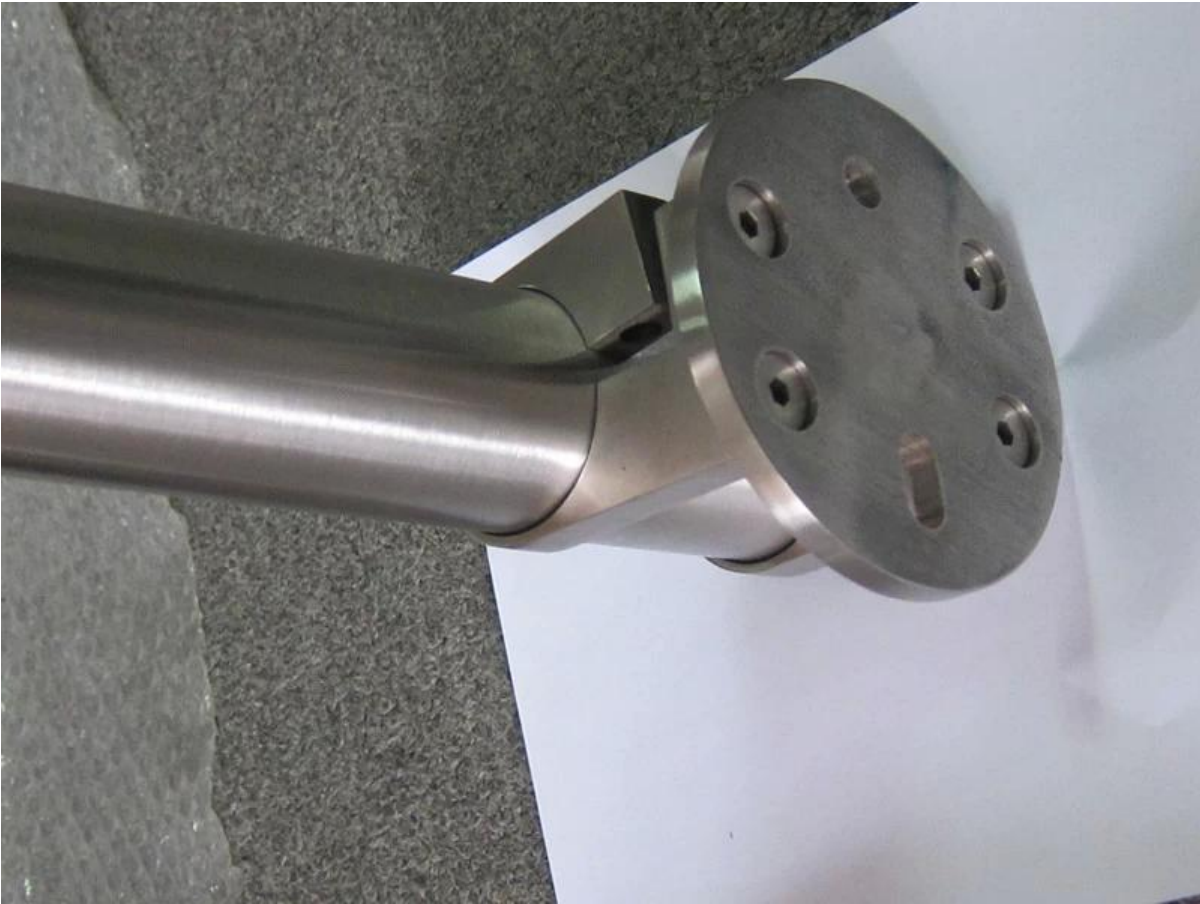
Fabricación china pasamanos de acero inoxidable para la escalera exterior, pasamanos de acero inoxidable