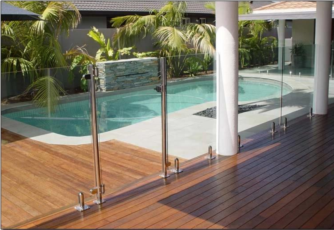
China proveedor grifo de vidrio de alta calidad, acero inoxidable 316 de espiga, mini mensaje de vidrio para los diseños de barandillas de vidrio sin marco