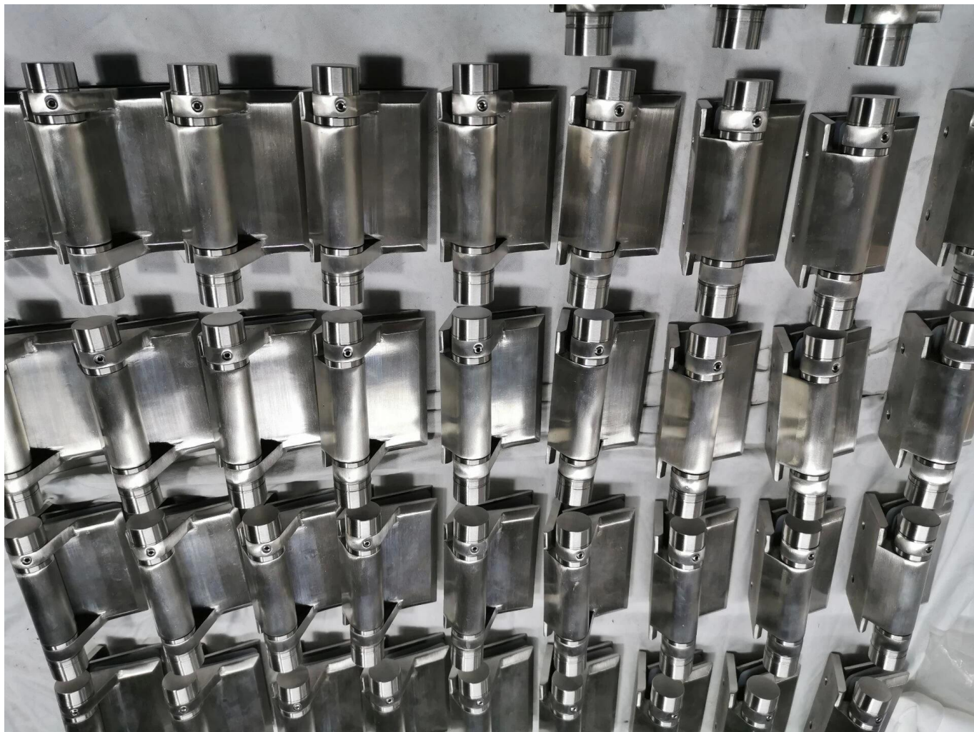
Lasi ho; e piirustus vaaditaan -