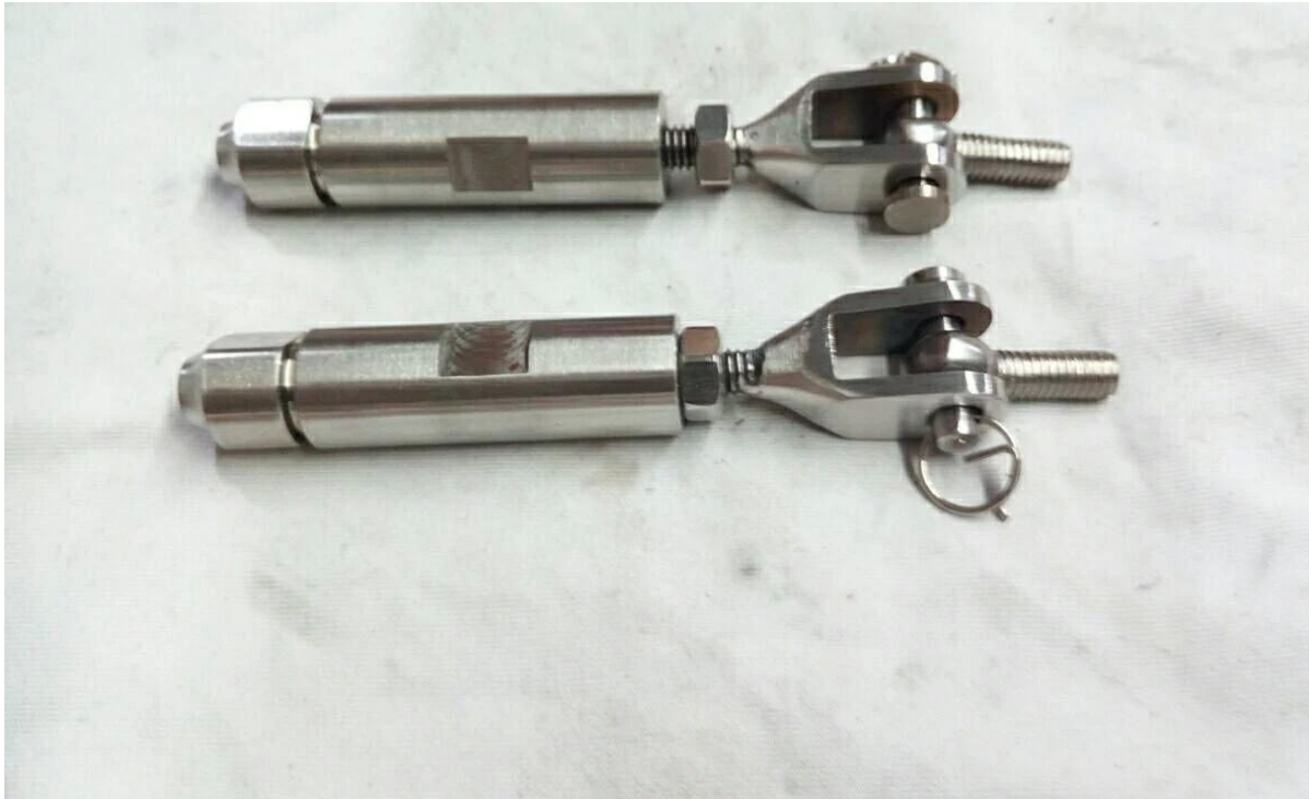
2) Kaapelin kiinnitys T803-mitta