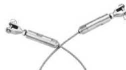
T803- 3mm/4mm/5mm cable