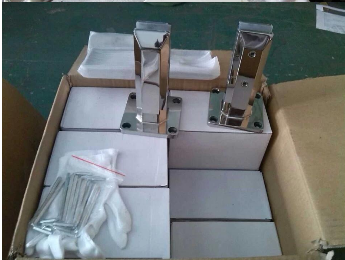
Tehdas ja sertifiointi