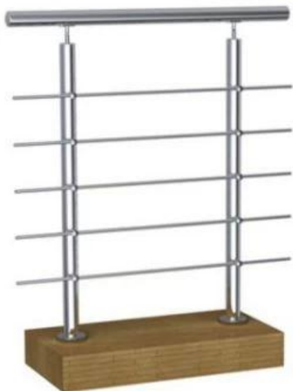
LCH-101 Top Mounted