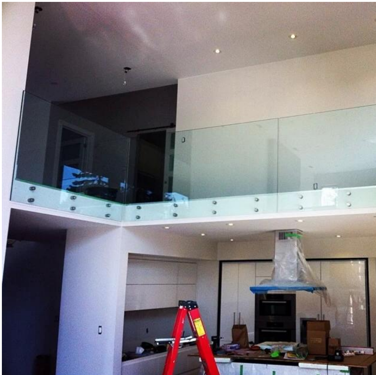
ulkona ja sisätiloissa lasin pattitilanne, kehyksetön päätyi lasi kaiteiden suunnittelu, ruostumaton teräs lasi pattitilanne kiinnike