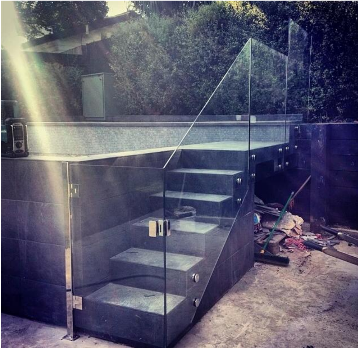
Kiina ruostumaton teräs parvekelasit päättyi kehyksettömät lasi kaide, ruostumaton teräs rappu lasi päättyi puutavaran aluslaudoitus