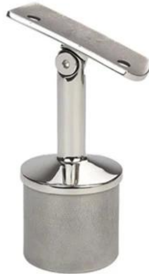
for dia38.1x1.5mm, 43x1.5mm,50.8x1.5mm pipe