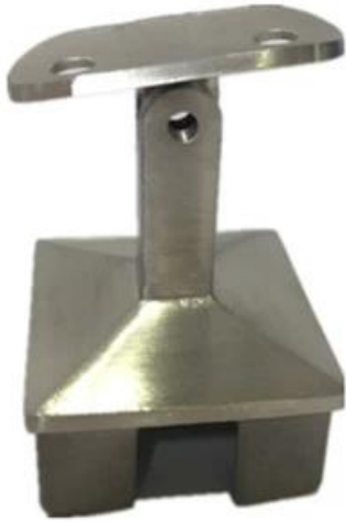
for 40x40x1.5mm, 50x50x1.5mm pipe