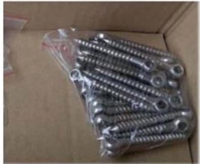
Wood screws , for wood mount