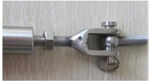
Mount to steel or concrete