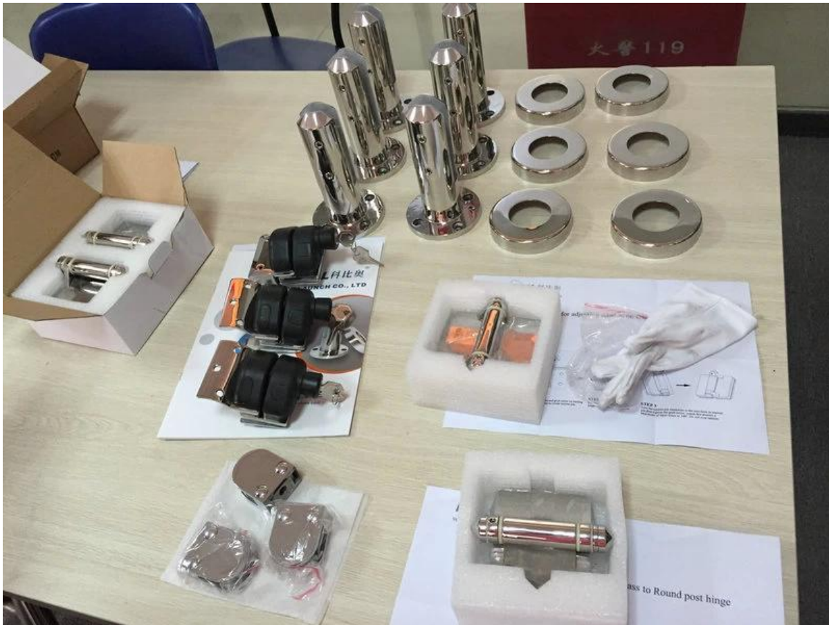
Project arviointi ulkona parvekke ja kannella, lasi spigot mini alkuun kaide;