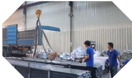
STORAGE & SHIPPING

Meillä on myös robottihitsaus tuotantoprosessin tehostamiseksi.