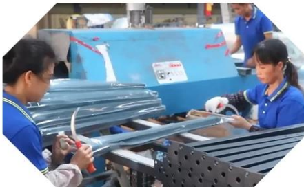
INSPECTION & PACKAGING