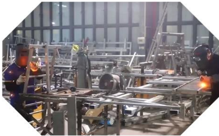
WELDING & POLISHING