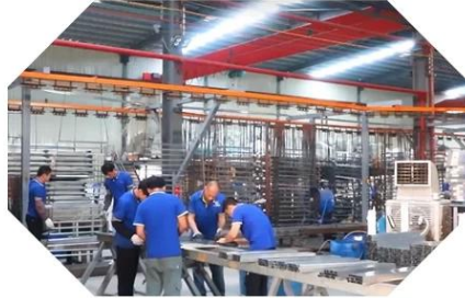
PAINTING & POWDER COATING