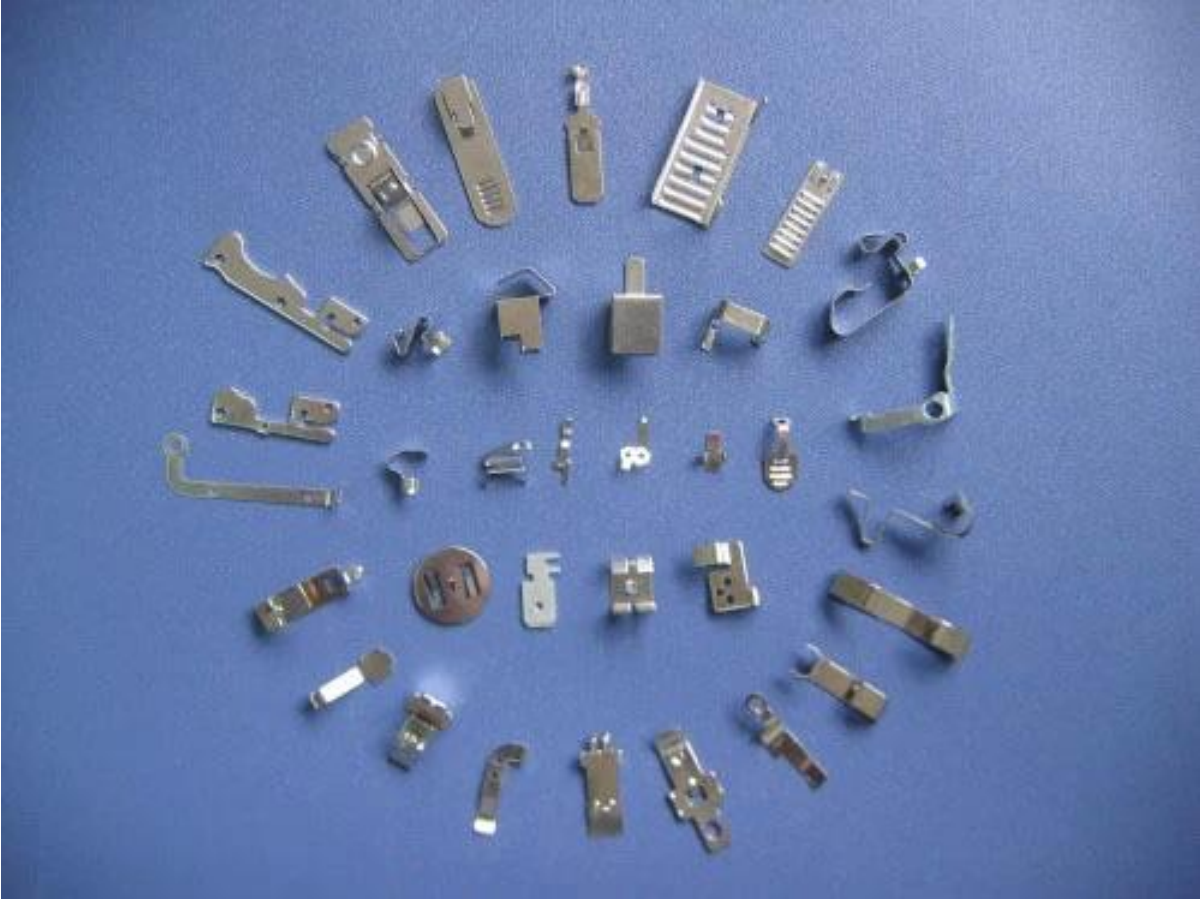
Sheet Metal Auton osat