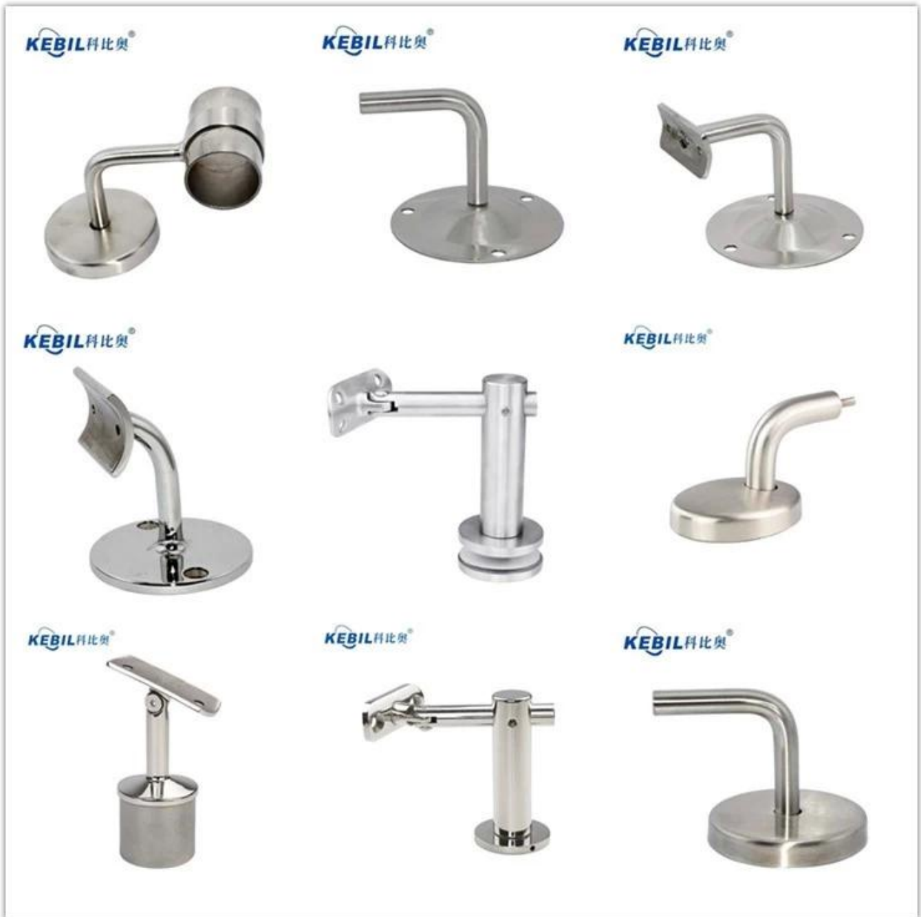
Projektikuvat lasikaiteista, joissa on lasikiinnitteinen kaidepidike -