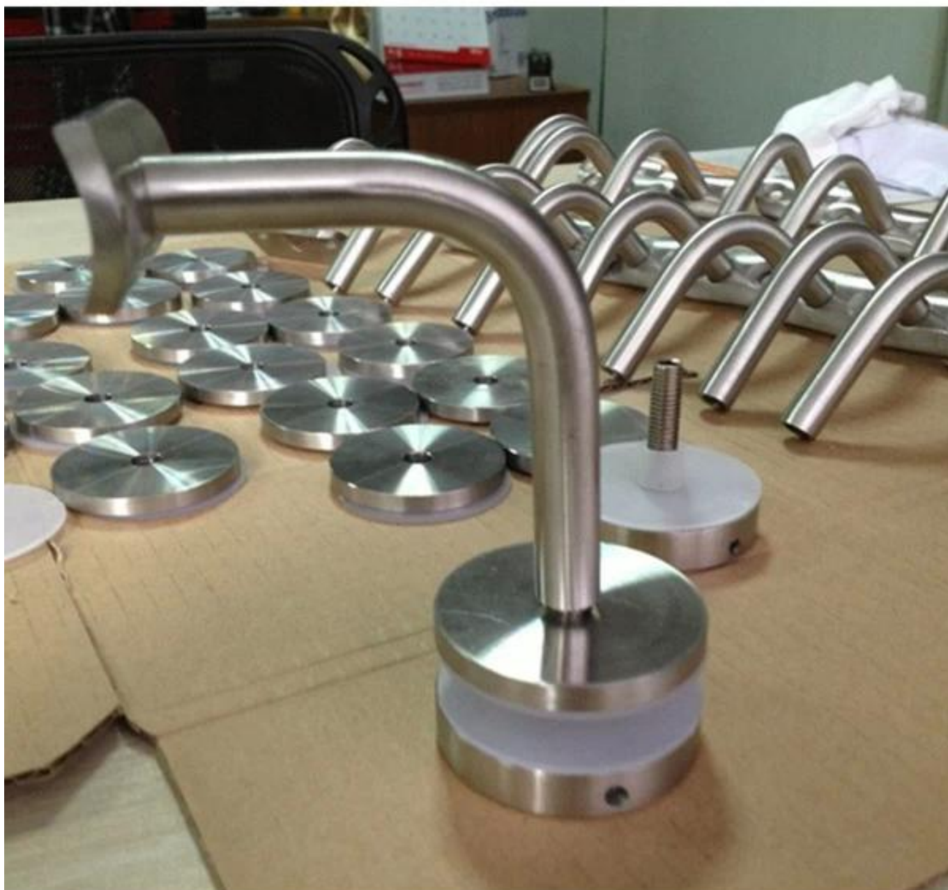
Lisää malleja lasikiinnityskaiteen pidikkeen pidikkeestä -