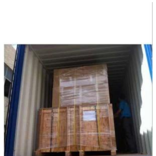
3. Full packaging