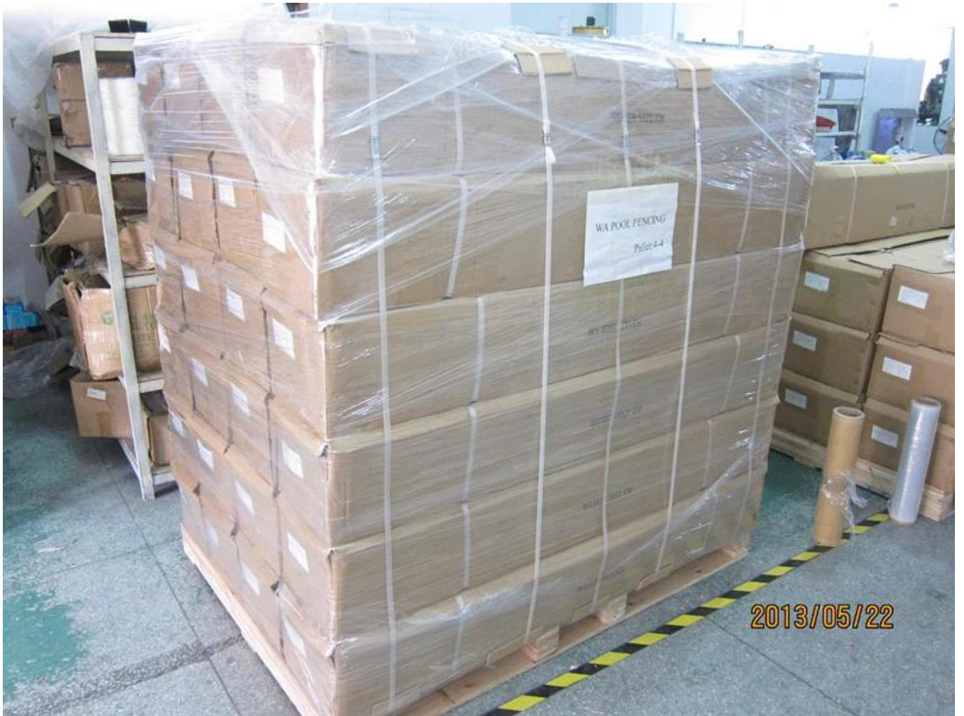
Tehdas ja sertifiointi