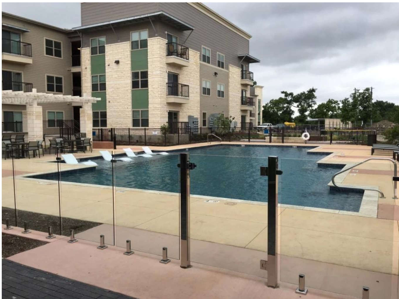
80x80mm neliön ruostumattomasta teräksestä valmistettu pylväskaide, joka on tarkoitettu kaupalliseen turvalliseen lasikaiteeseen