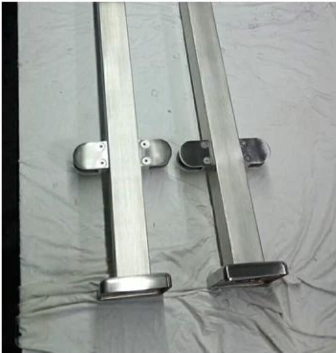
50x50 neliön pylväs ja lasihana suunnittelu portaiden ja tyhmien aita: