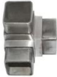
3-way tube connector