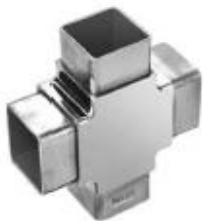
4-way tube connector