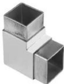
2-way tube connector