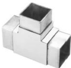
3-way tube connector