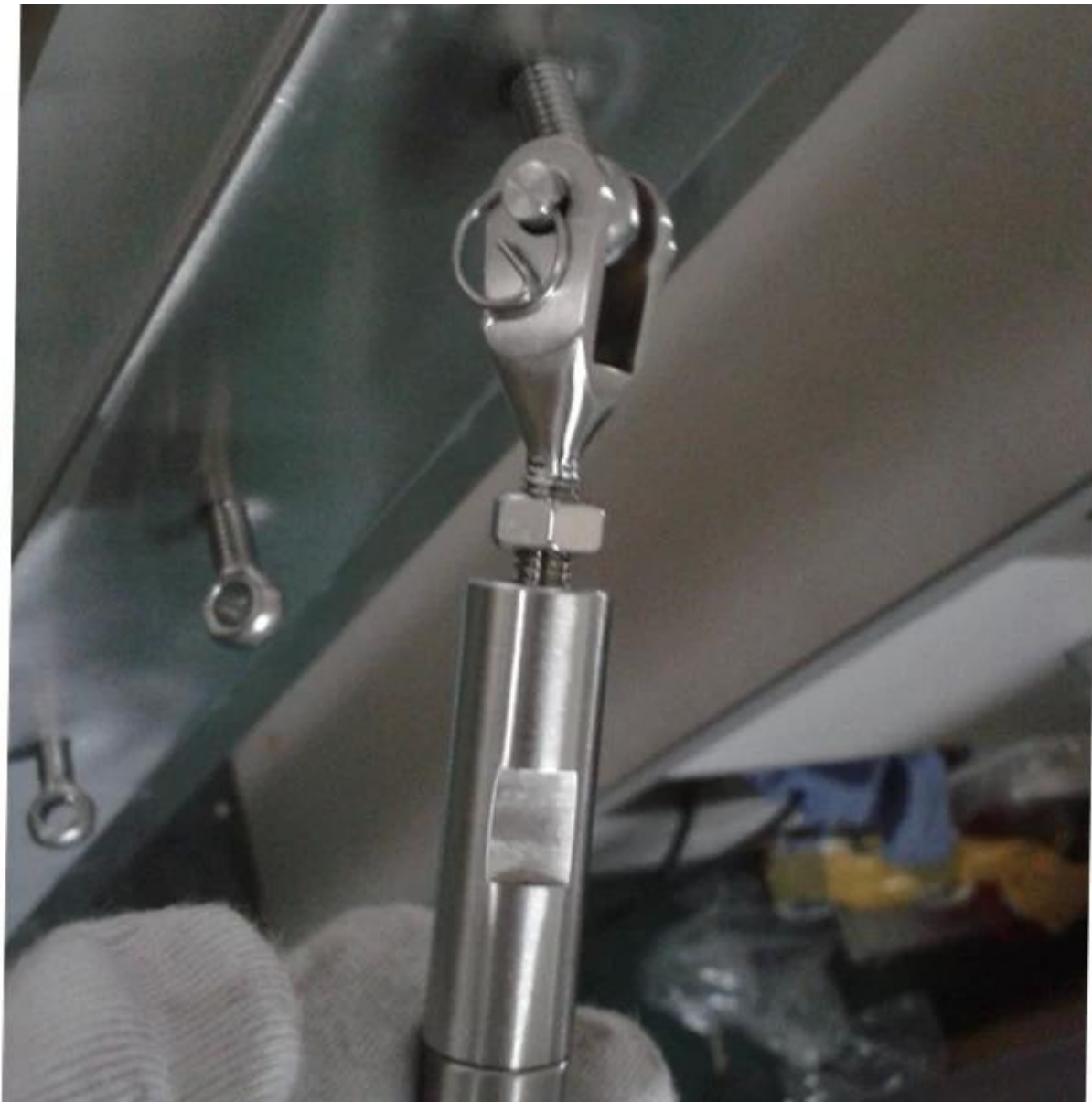
Kaapelin kiinnitys T803-koko