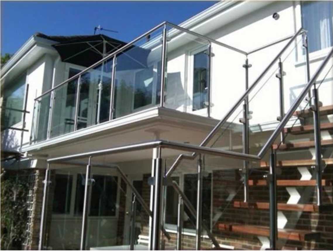
neliö tyyppi virkaa, pohjalevyn tyyppi