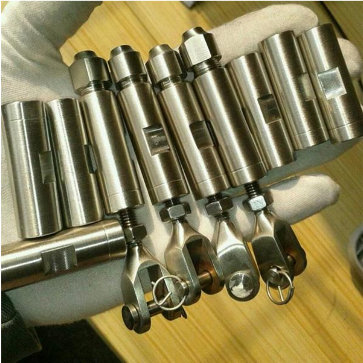
Project L.A Kaliforniassa