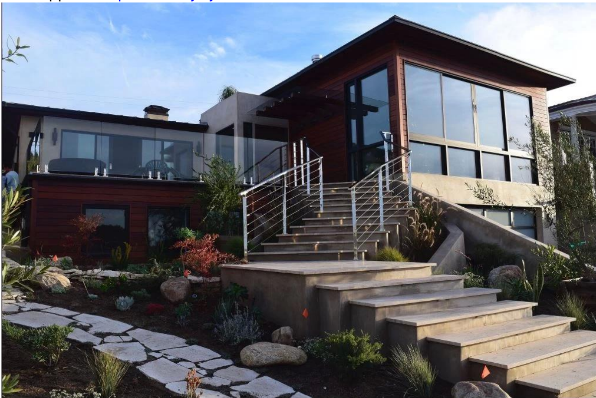
Lasi tappi + lasi puristin CB-180 + CB-90