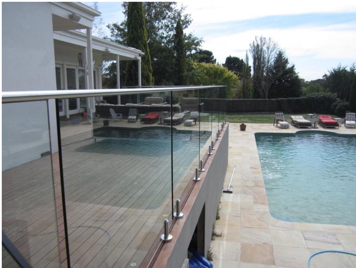
Lasi tappi + kaide kiinnike