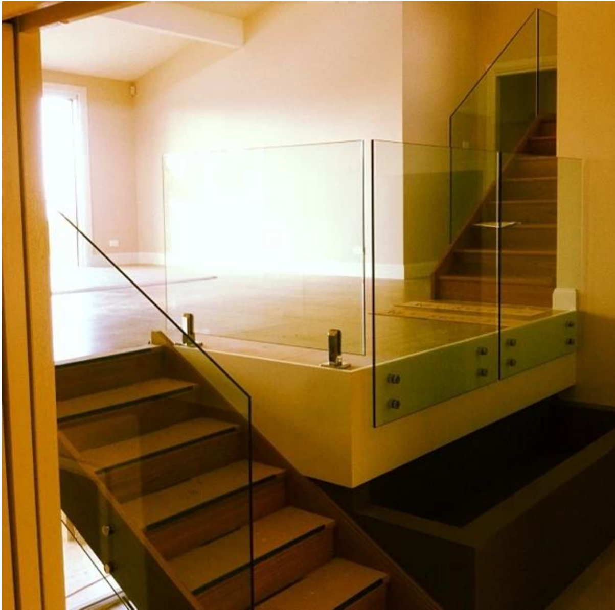
Lasi tappi + karkaistu lasi