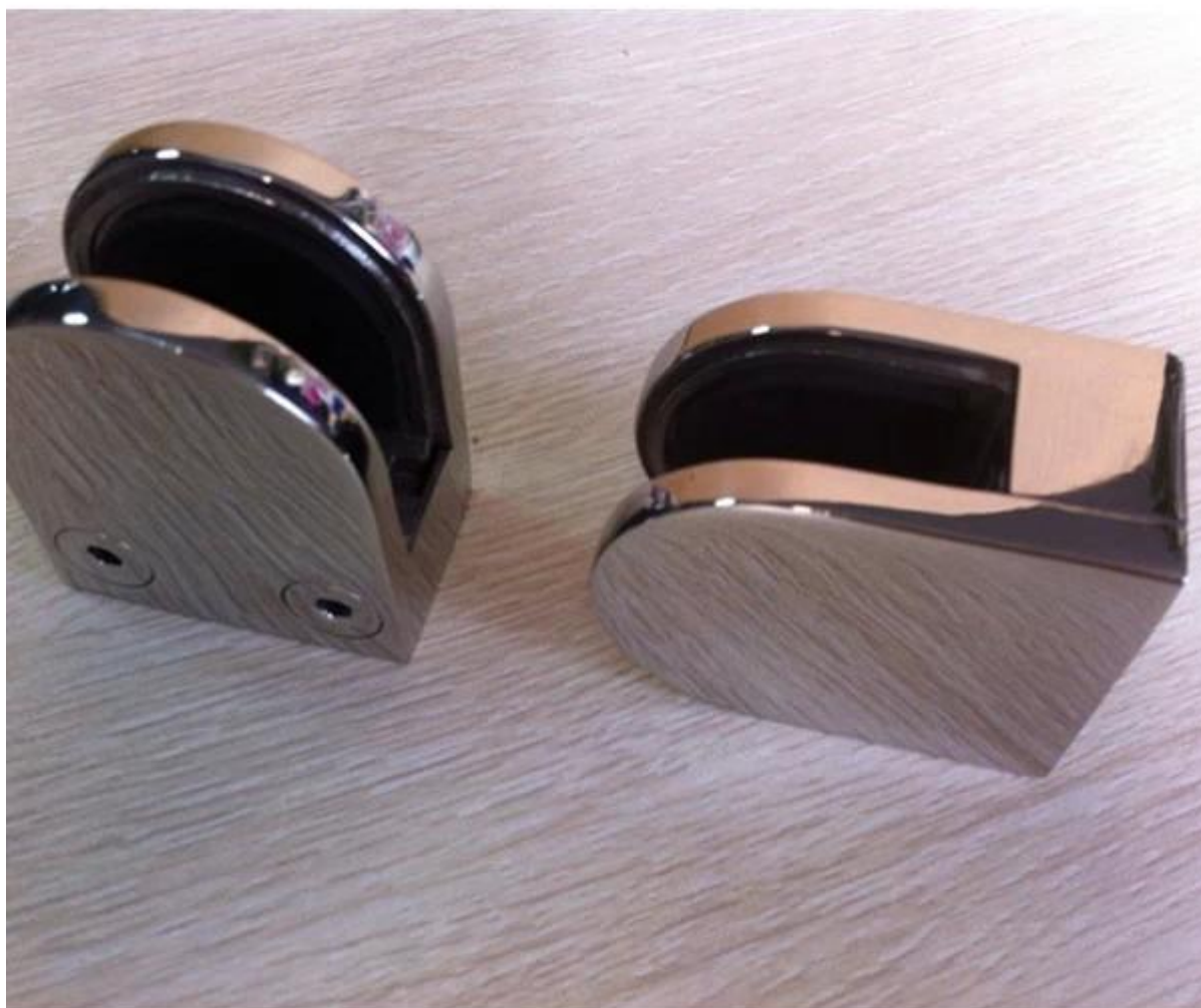
3.brushed viimeistely ja kiillotettu viimeistely Vertailun