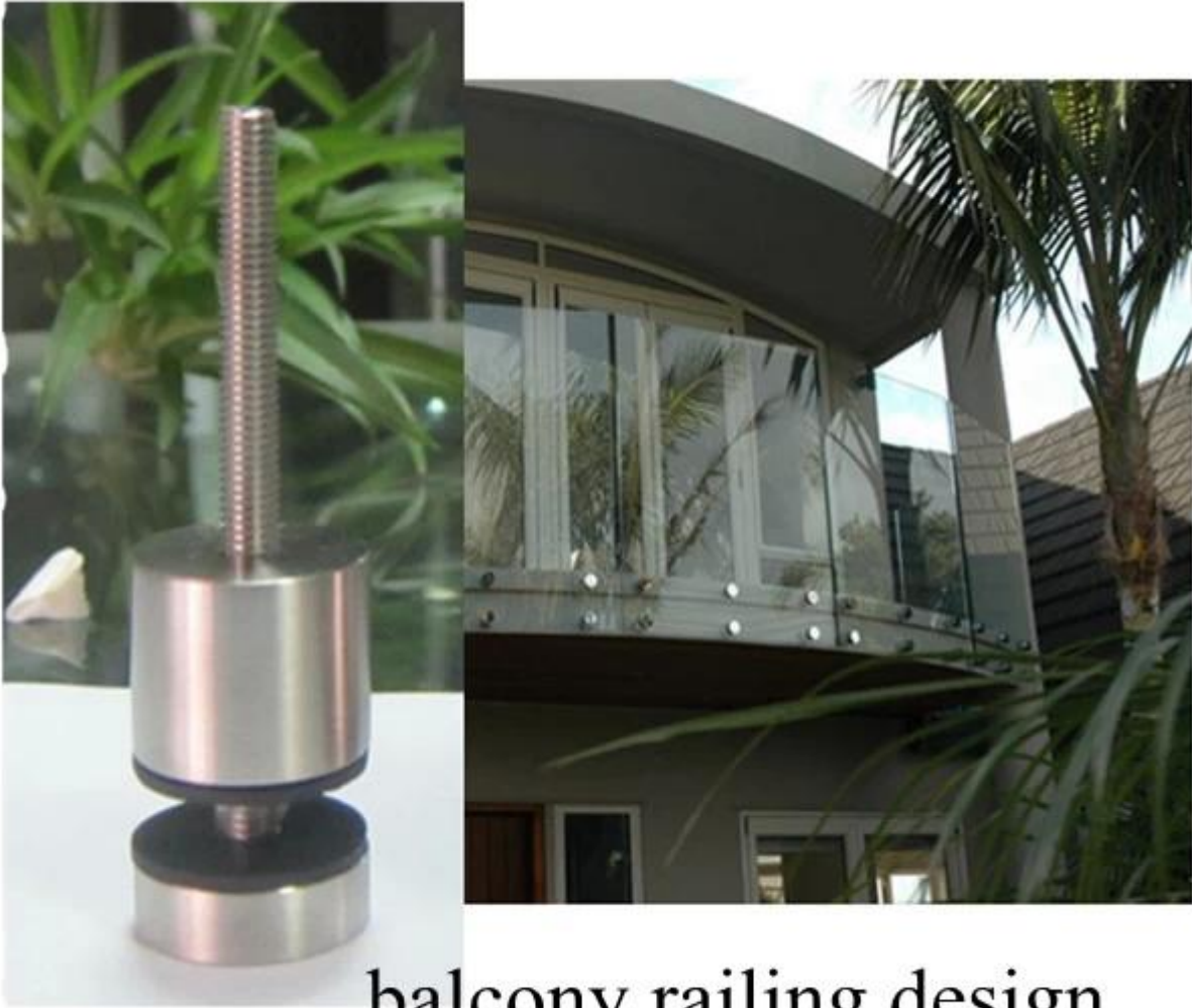
balcony railing design