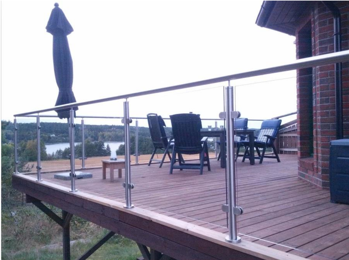
ruostumaton teräs lasi kaiteet ulkoportaatt posliinia, lasia kaide järjestelmä parveke