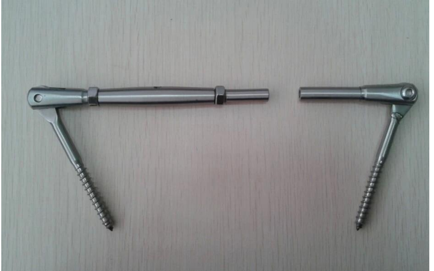
Piirustus T804: lle