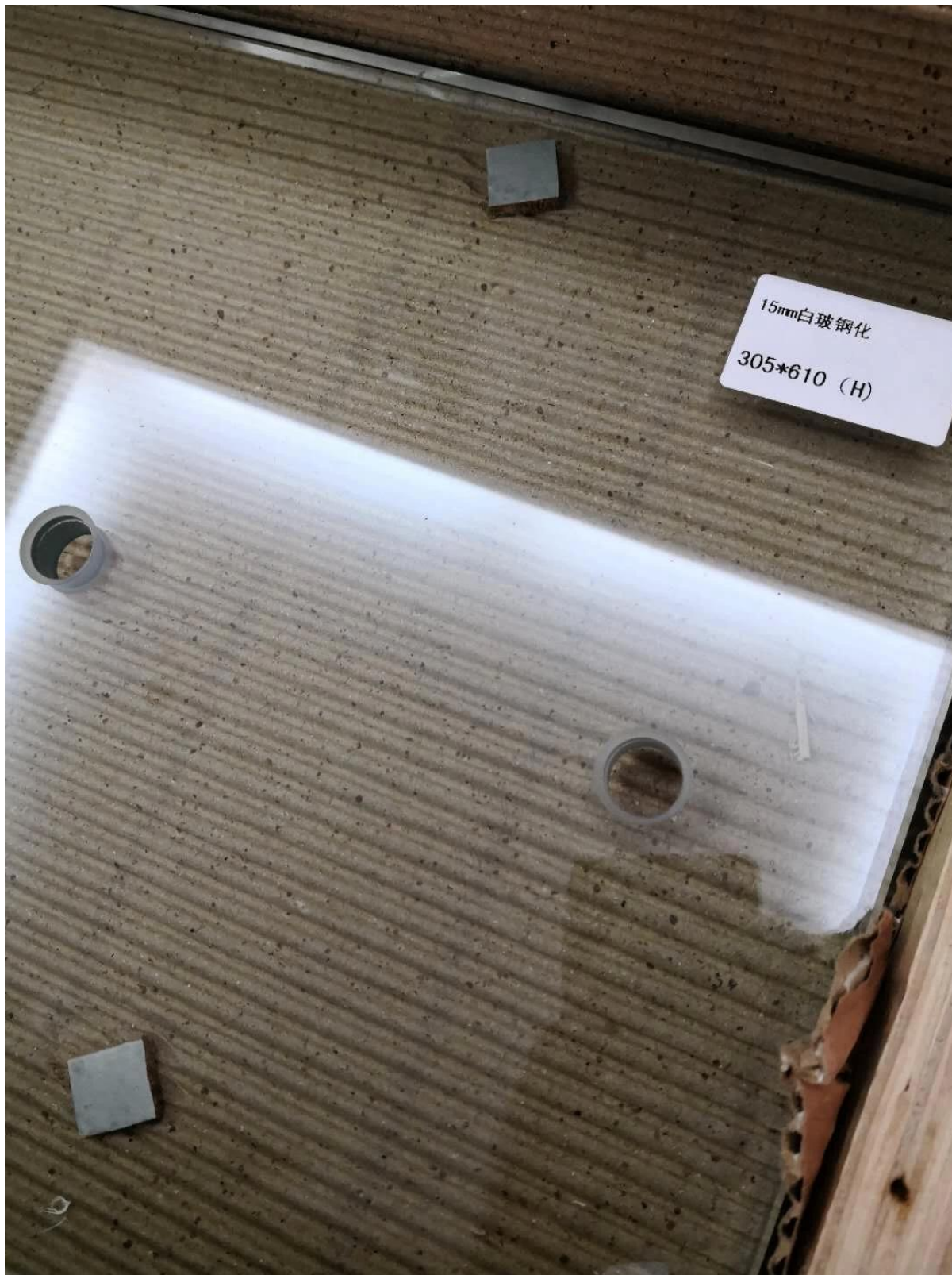
karkaistu lasi testi -