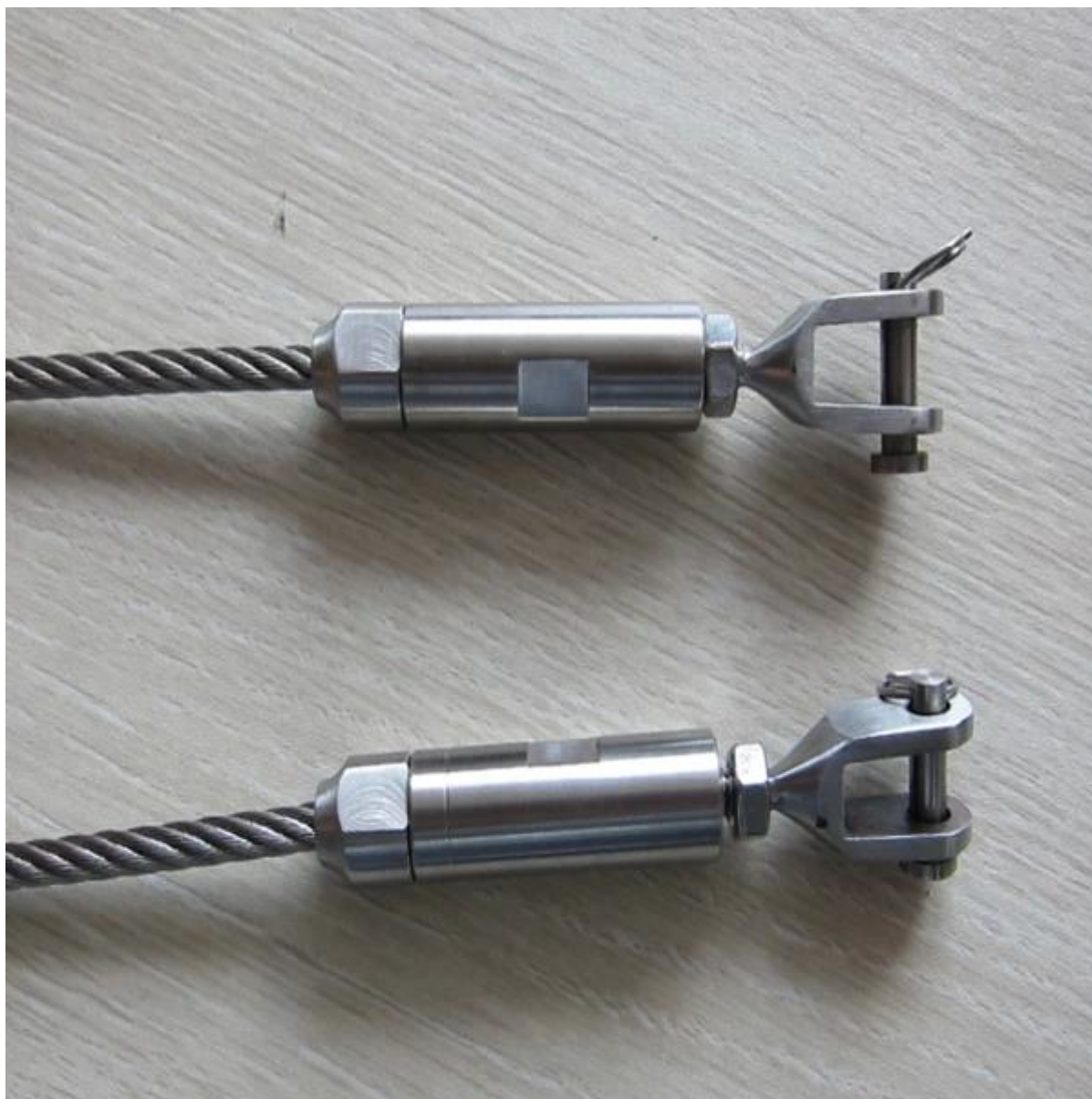
Kiina vaijeri kaide rappu, kiina ruostumaton teräsvaijeri kiristin parveke