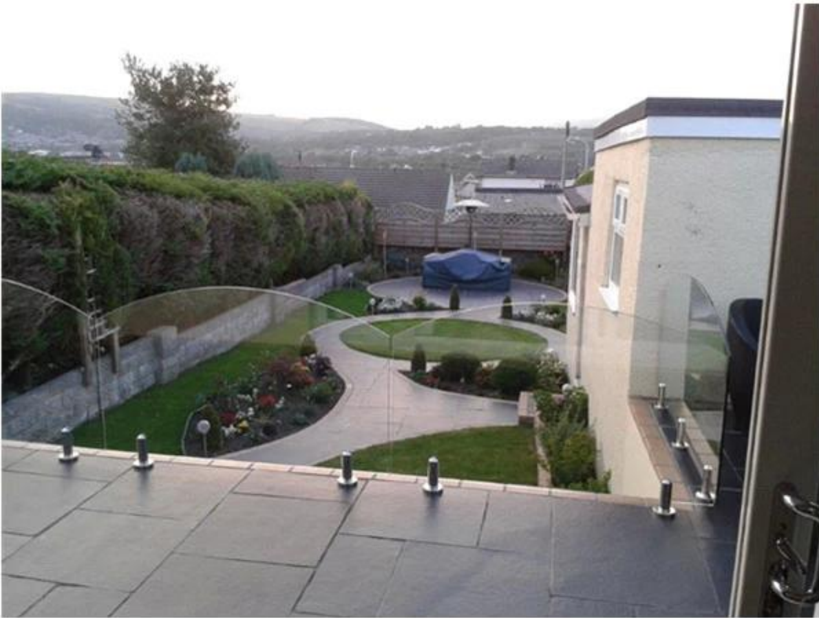
glass balustrade system