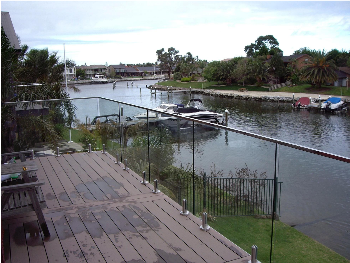
3). ruostumaton teräs kaide korttipaikka putki sisätiloissa lasi kaiteet: