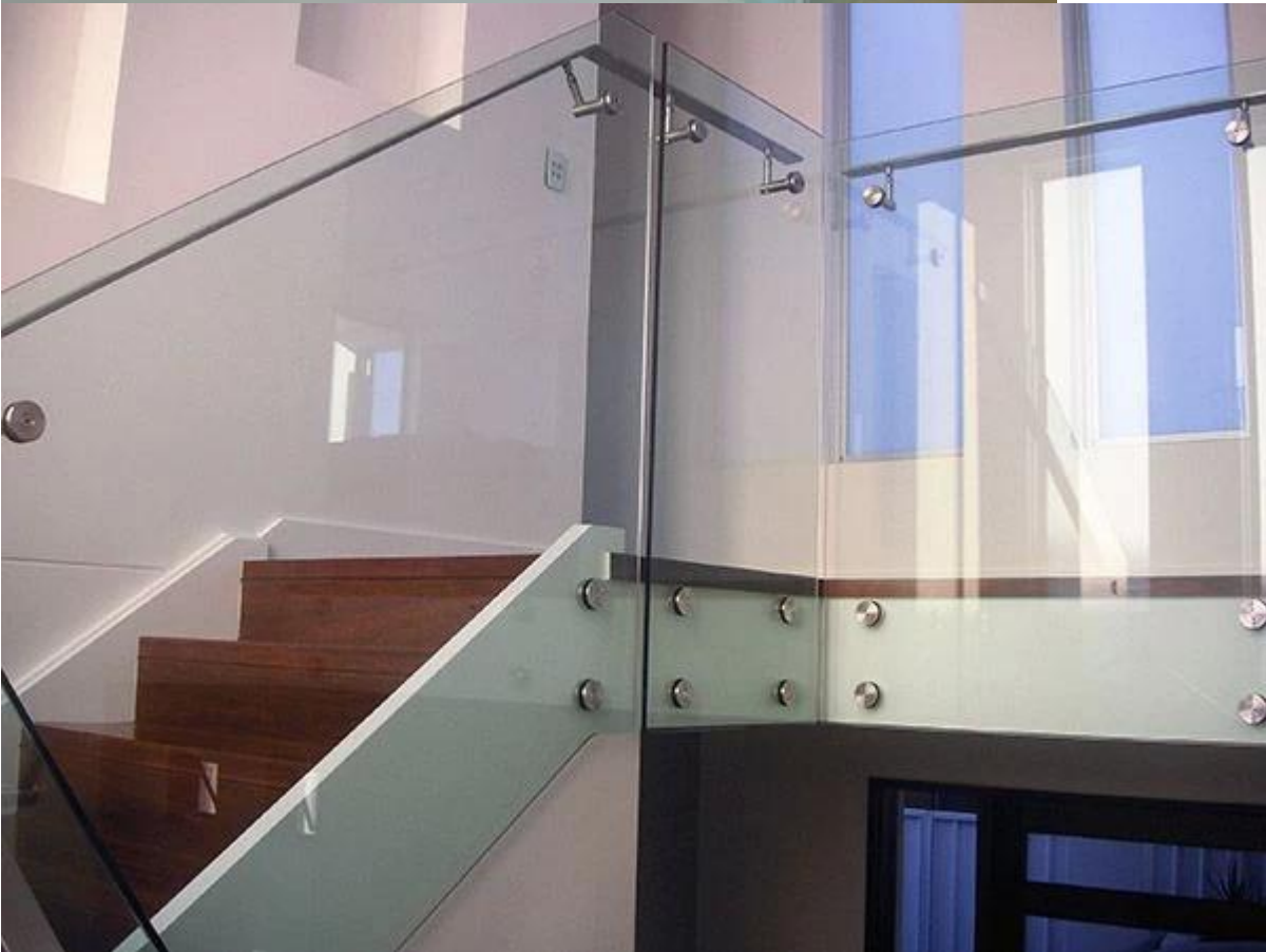
Kuva Kehyksettömät Glass Parveke Kaide System: