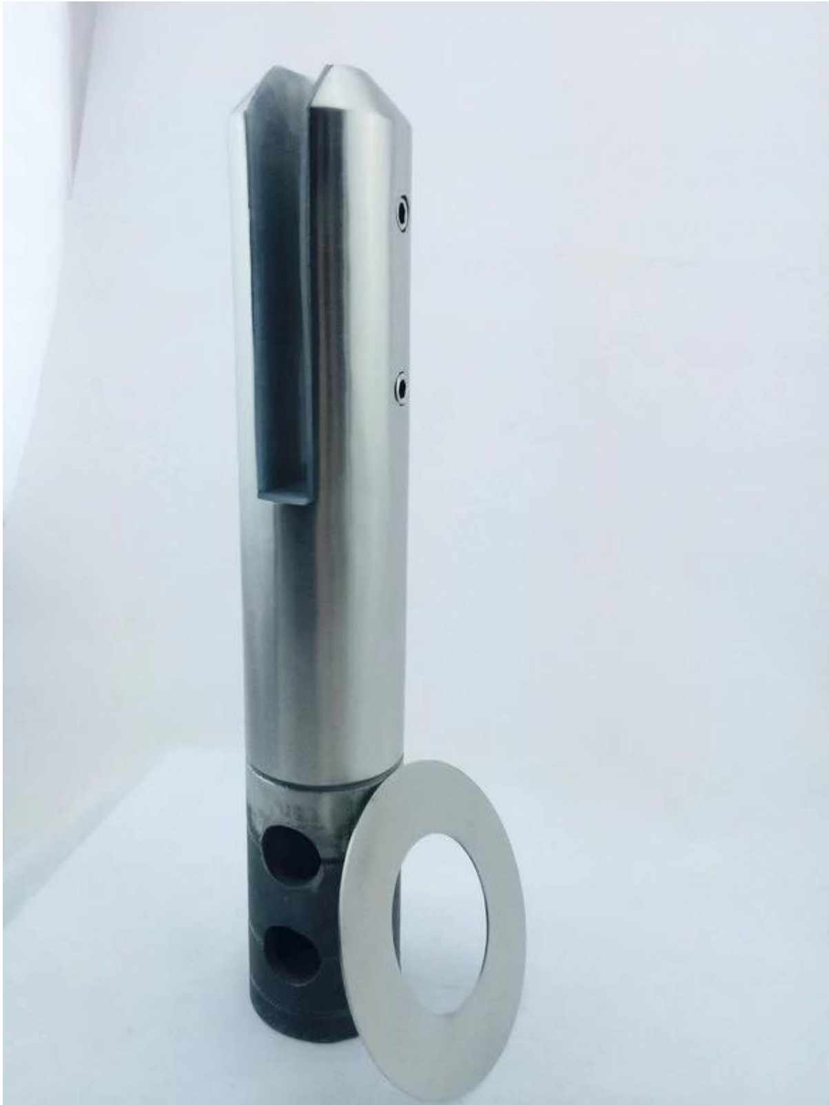
Neliö ja pyöreä core pora liitoskauluksen sAtin harjattu, tyylikäs pinta;