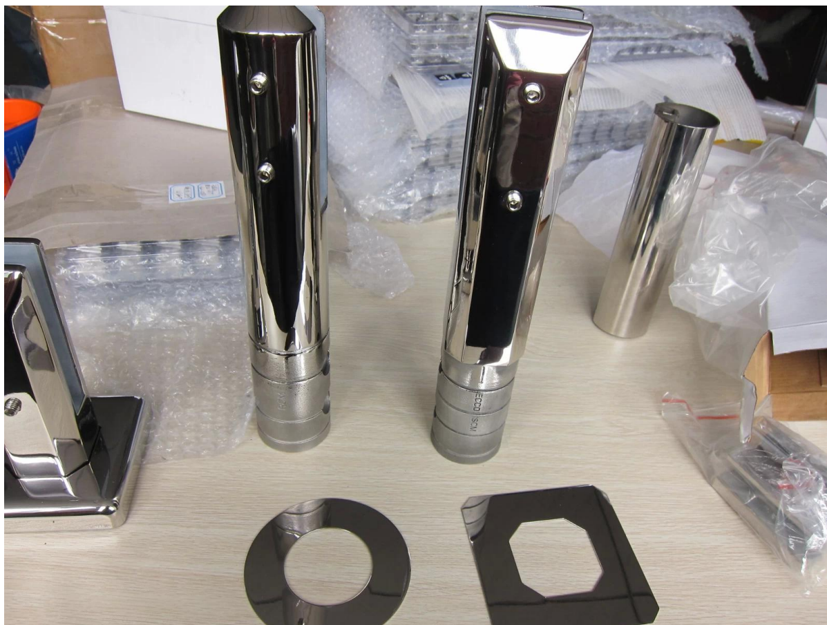
2.MOdel No.RCM-2 hana (Round core pora tappi)