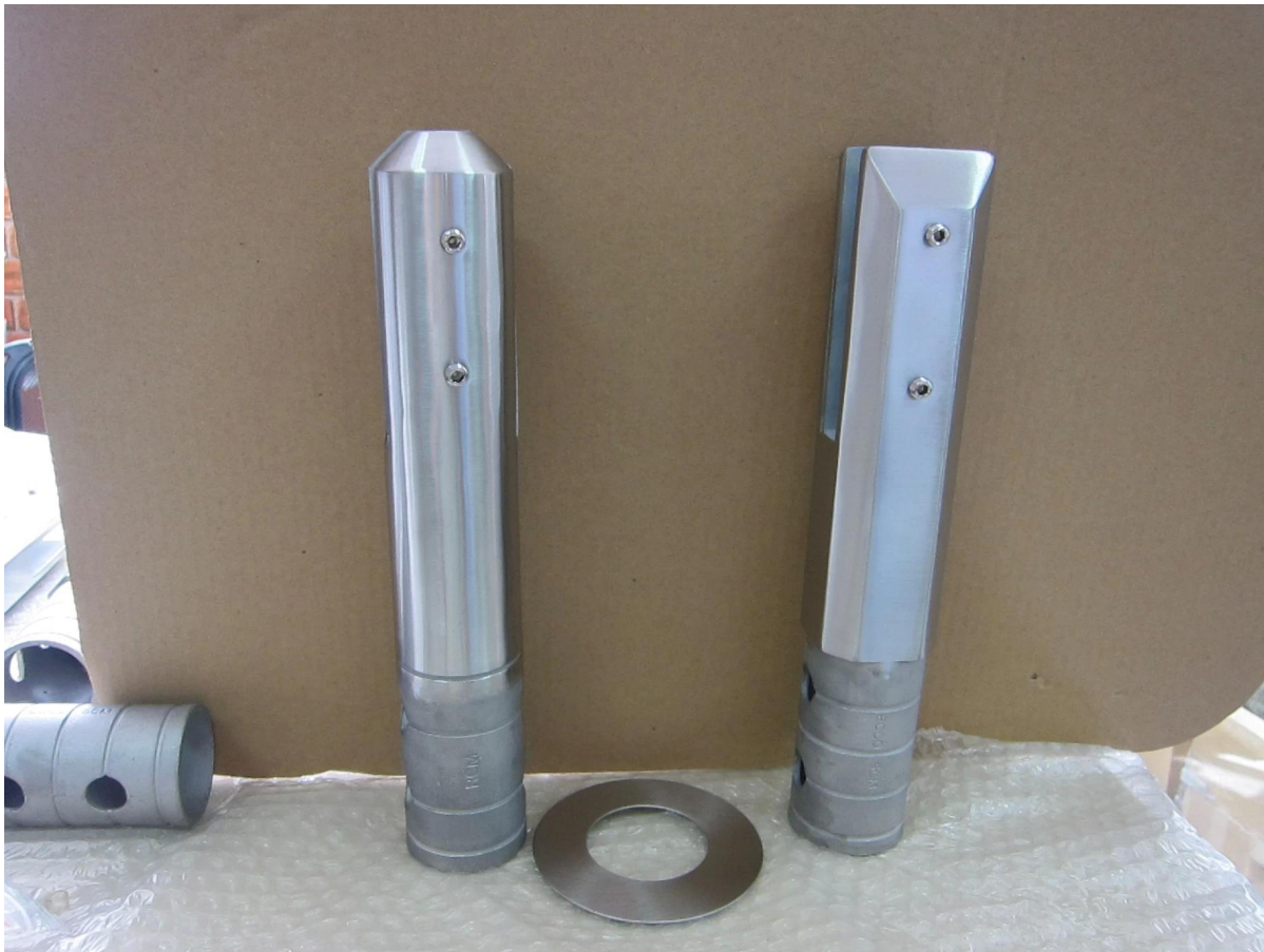
3. Kruunuporaustekniikka & pohjalevy 4 tyyppiä tappeja

javascript: void (0); / * 1467362864636 * /