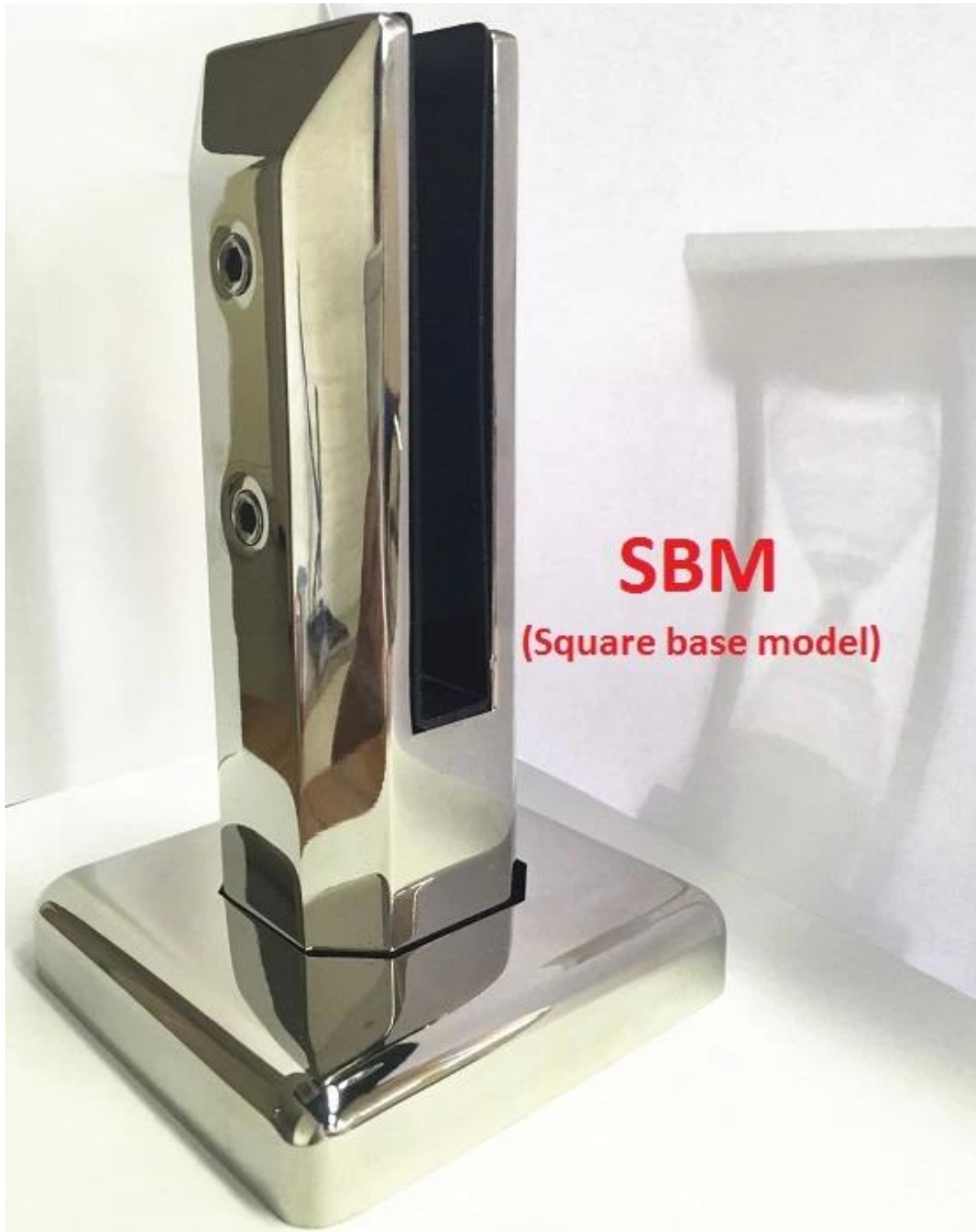
SBM (Square base model)