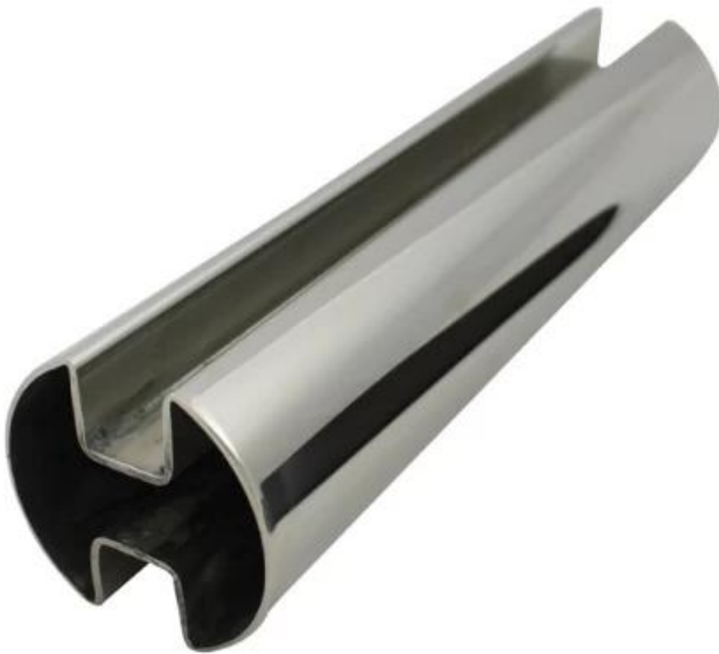
# 3 Double Slot Pipe, kaksisuuntainen 90 astetta: