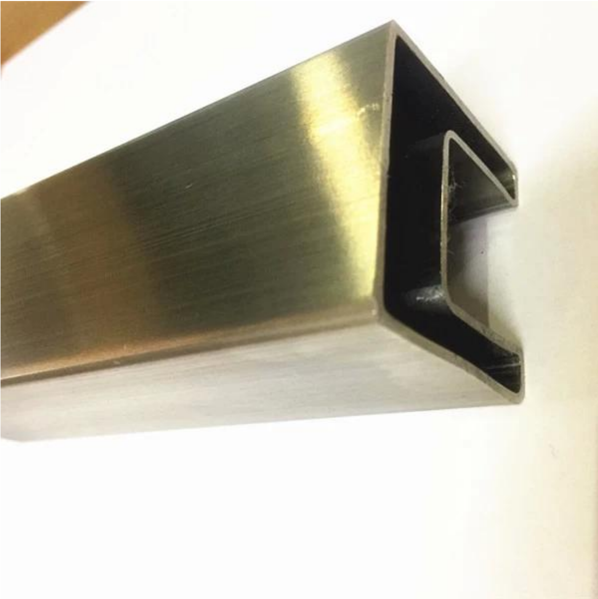
# 5. 20 x 25 x 1,2 mm, 14 x 14 mm: n yksittäinen korttipaikka: