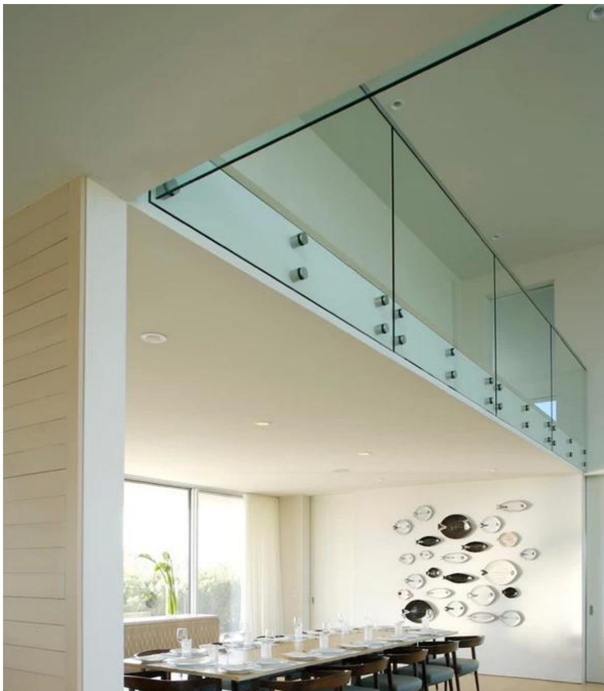
4. lasikaide laitteisto ruostumaton teräs standoff kiinnike Malli No.SF-50T : javascript: void (0); / * 1469851036100 */