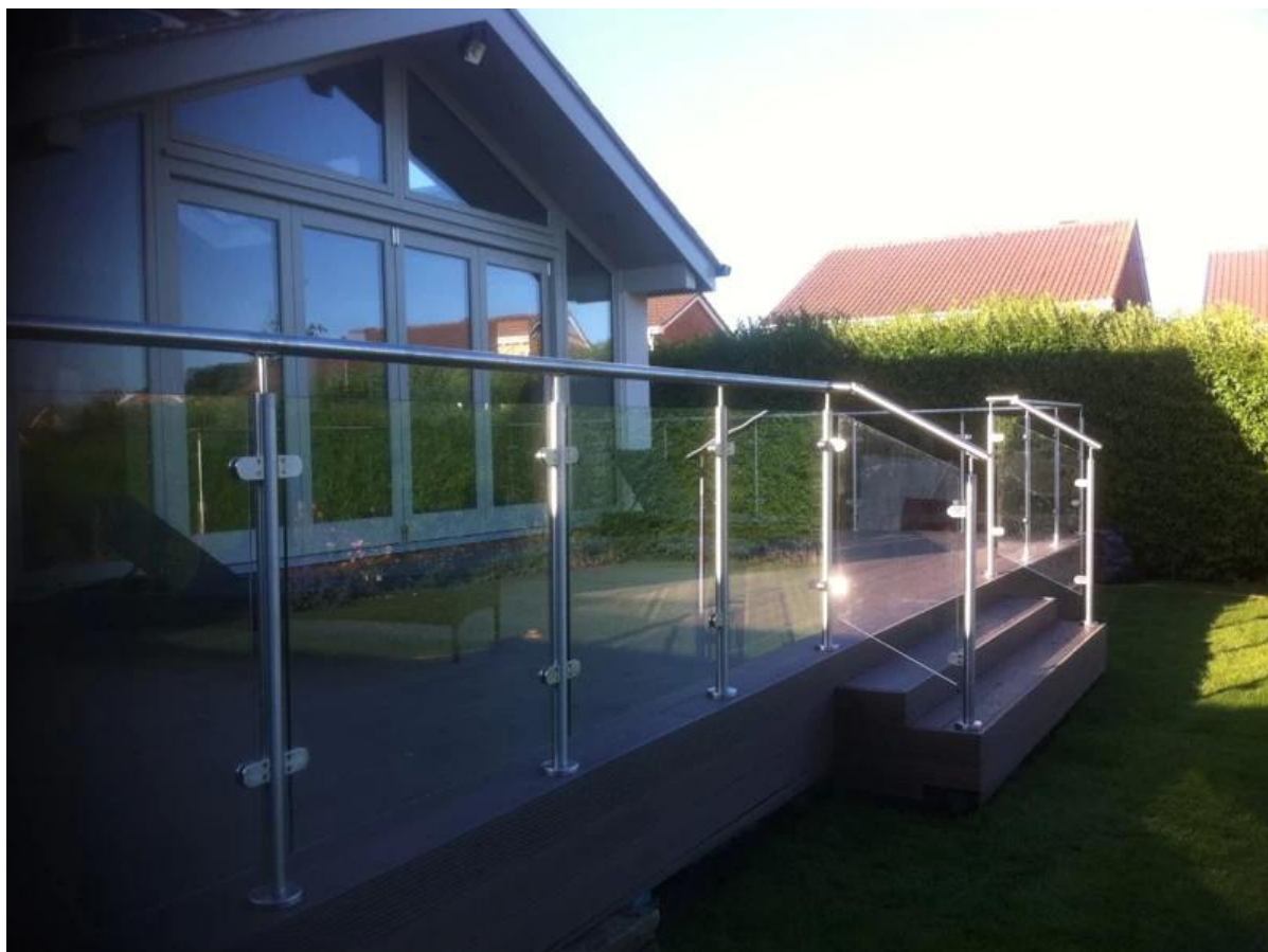
2. Spigot kehuksetön kaide suunnittelu: javascript: void (0); /* 1464400047103 */