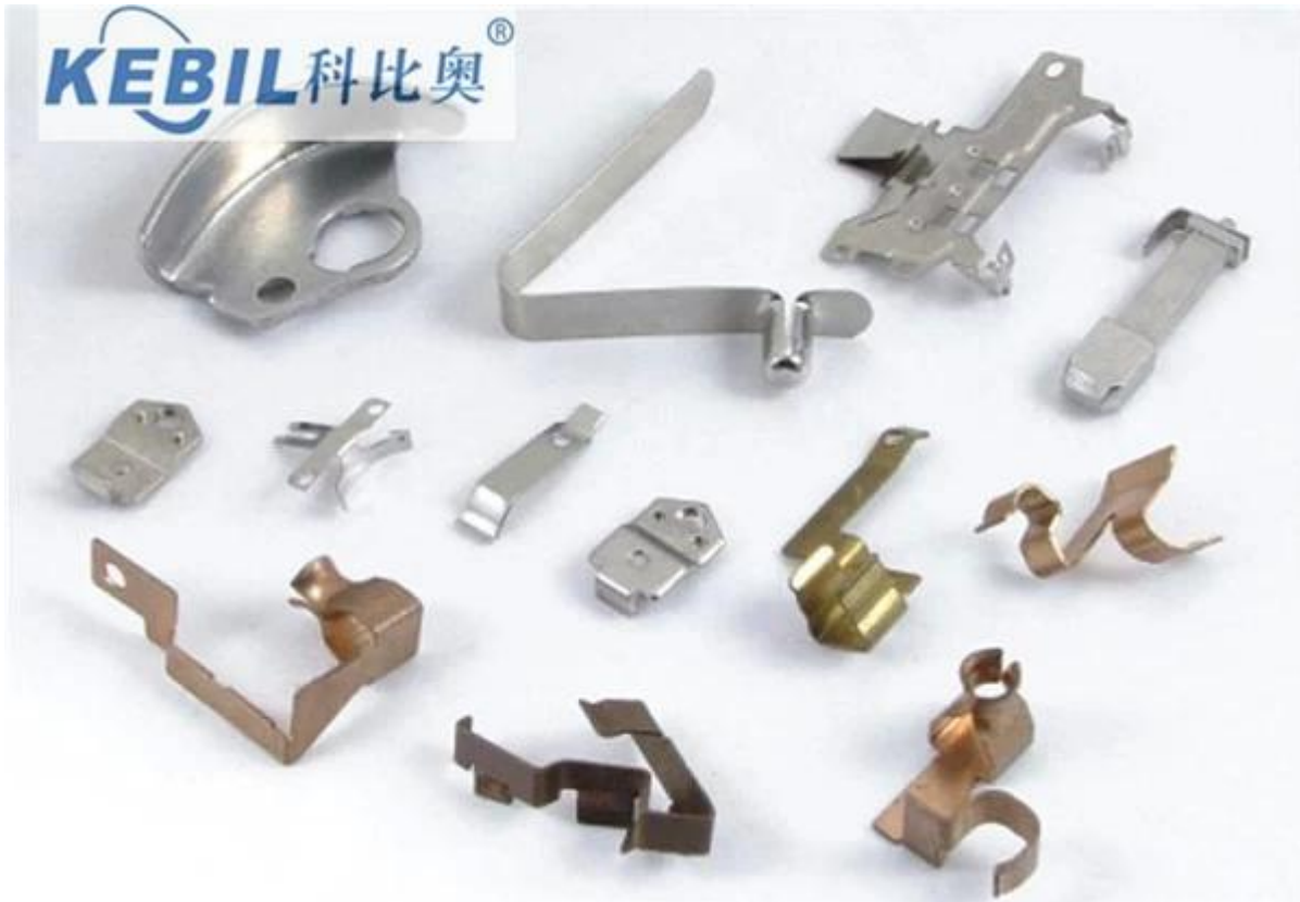
tarkkuus metalli leimaamalla mukautetun design osat