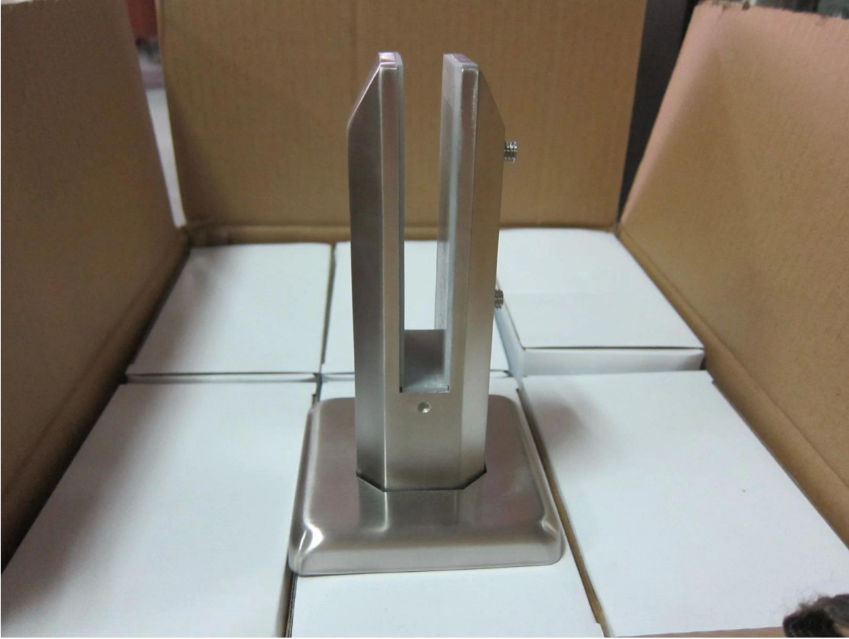
3. Malli nro SBM Ruostumattomasta teräksestä Hankkeen valokuvia,