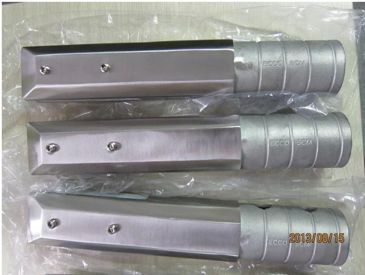
Peilikiillotettu neliö ydin porattu tappeja